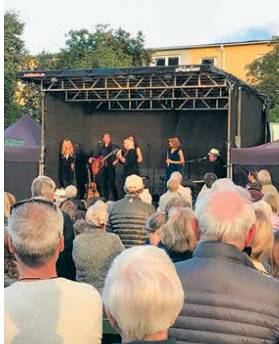
Parkteatern var tillbaka i Täby i somras och "The Visitors" hyllade ABBAs låtskatt.

olika kulturföreningar berikar Täby på olika sätt och vi är övertygade om att kulturhuset är en viktig pusselbit i arbetet att göra Täby till en kulturkommun.