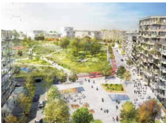
Illustration: Nyréns arkitektkontor AB

Då gäller det att det fattas kloka beslut. Beslut som leder till lösningar som förbättrar trafiksituationen och leder till lika bra eller bättre lösningar för den enskilde. Det handlar om att skapa trygga och gena stråk av gång- och cykelvägar så att barn och ungdomar på egen hand kan ta sig till sina skolor och fritidsaktiviteter. Att fler väljer att cykla till närmaste hållplats eller station för att ta sig vidare med pålitlig kollektivtrafik. Att fler väljer att cykla