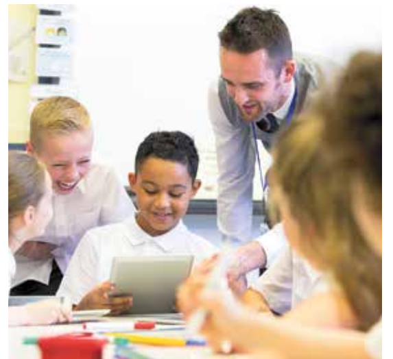
Täby har idag en av Sveriges bästa utbildningsresultat både på grundskolenivå och på gymnasienivå.

Regeringens förslag är ett slag mot alla duktiga privata aktörer, alla lärare som arbetar i dessa och mot alla de tusentals elever som av olika skäl har valt just en fristående skola. Vi behöver fortsätta arbeta för en likvärdig skola som håller hög kvalitet och som ger alla elever samma förutsättningar att lyckas. Därför uppmanar vi regeringen att slänga förslaget i papperskorgen där den hör hemma och istället främja kvalitetsskapande åtgärder som ökar likvärdigheten bland landets skolor.