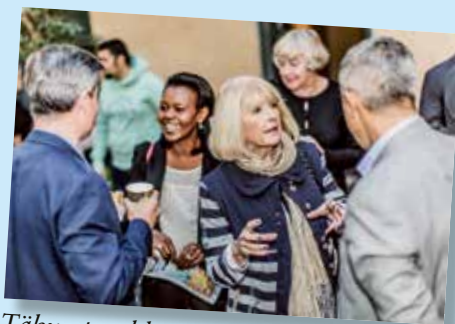
Täby utvecklas med frihet och trygghet för en hållbar framtid. Det är en alldeles utmärkt ledstjärna för Täby

Varför fungerar inte EU när flyktingsituationen gör att samverkan behövs som bäst? Det är en fråga om internationell och nationell politik. Här i kommunen vill vi liberaler göra allt som är möjligt för att se till att människor som är på flykt från krig och förtryck kan få en fristad och möjlighet att bygga ett nytt liv. I Täby finns både kompetens och förmåga. Förskolor, skolor, föreningar, väl fungerande arbetsplatser och en proaktiv kommunal organisation. Nu behövs även kreativa förslag på hur bostadsfrågan kan lösas.