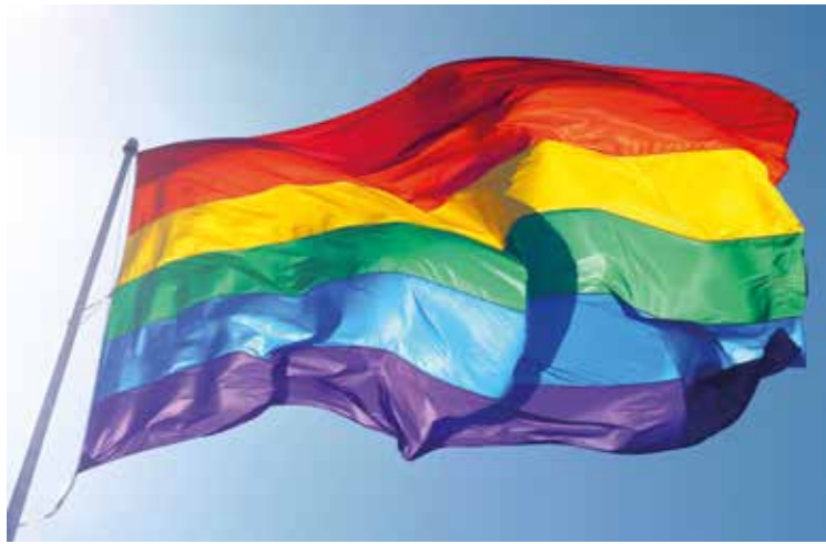
Att hissa regnbågsflaggan vid Täbys kommunhus varje år under Stockholm Pride är en viktig symbolhandling

2011 tog vi initiativ till att hbt-certifiera ungdomsmottagningen i Täby. Sedan dess har 15 verksamheter cer-